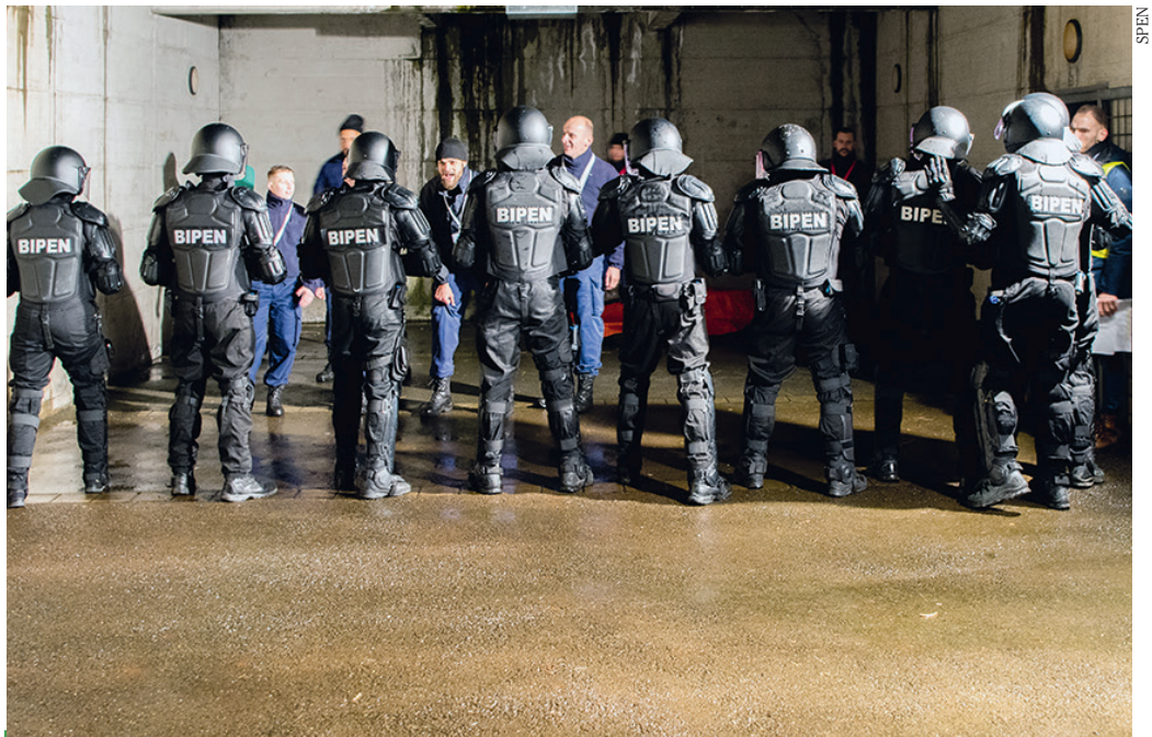
Dans le scénario, la Brigade d'intervention pénitentiaire (BIPEN) a dû faire face à une mutinerie de personnes détenues (campées ici par des aspirants de l'Académie de police de Savatan) dans la cour de promenade.

Cet exercice avait quatre objectifs. D'abord, former et évaluer les compétences de conduite des cadres intermédiaires et supérieurs du SPEN. Ensuite, évaluer et développer les compétences techniques et tactiques de la Brigade d'intervention pénitentiaire (BIPEN). Troisièmement, mettre à disposition du DARD des situations d'entraînement adaptées au contexte pénitentiaire, pour maintenir et développer leurs compétences. Enfin, il s'agissait d'évaluer et développer la collaboration entre les deux groupes d'intervention. ■